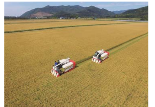
上士別地区の大区画ほ場の刈り取り

また、平成21年に着工した国営農地再編整備事業上士別地区では、ほ場の大区画化と効率的な機械化作業体系の確立、農業経営の低コスト化を目指し、行政、JA及び本土地改良区が一体となって事業推進に努め、中心経営体への農地集積を行うとともに、大規模ほ場（最大のほ場で6.8ha）の更なる作業効率の向上を図るため、ICT技術を活用し自動給水栓の導入（水管理作業時間の約60%短縮）やロボットトラクターの自動走行による田植え作業の実施（10a当たりの農作業時間が40%短縮）などにより省力化と作業時間の短縮を実現している。これにより経営規模拡大や高収益作物の生産拡大、6次産業化も図られ、農業収入の増加によるUターン、新規就農者の確保にもつながるなど、本地域の農業・農村振興に大きく寄与している。