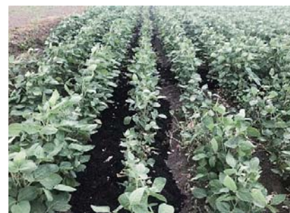
地下かんがいによる大豆栽培

整備事業により、平均0.4haだった狭い水田は、平均2.5haに大区画化された。また集中管理孔を備えた暗渠排水を整備し、大豆や麦など転作作物への地下かんがいを実践。用排水施設のパイプライン化も進めている。