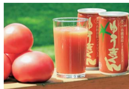
トマトジュース等も開発・販売

地区内では、トマトジュースや甘酒などの開発・販売に力を入れたり、収穫した食材を使った飲食店を経営したりと、意欲的な担い手農家が活躍している。今後も整備事業による大区画化を推進し、ICTなどを積極活用した効率的な営農を実現することで、経営面積の拡大や余剰時間を活用した新たな農業経営の展開を目指している。