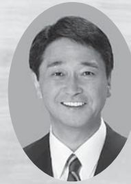
参議院議員 全国水土里ネットワーク会長会議顧問