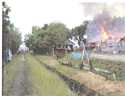
防火用水・用水からの消火活動