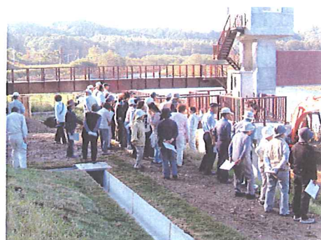
終了後施設見学会