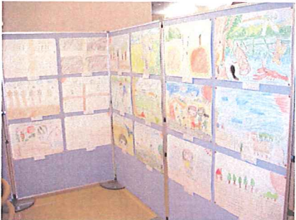
○「しゃきっとプラザ」展示