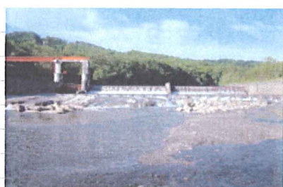
羽幌頭首工（スキー場の近く）