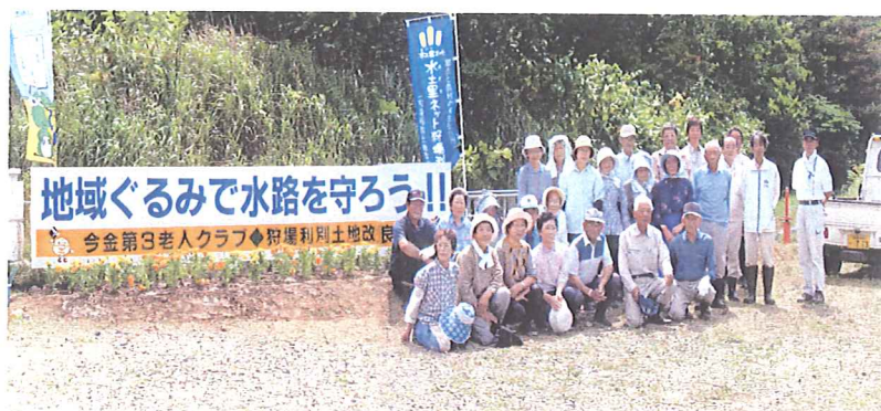
老人クラブによる花壇整備

農業用水路が有している洪水防止や水の浄化作用などの多面的な機能を、地域住民に知ってもらうため今金第3老人クラブと連携し花壇整備・草刈を実施した。今後、このような活動を継続実施し、地域住民の理解を一層深めていく。