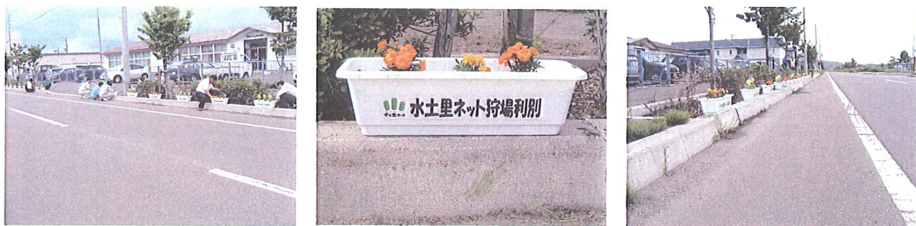
役職員による植栽風景

道々沿線に突如出現!! 平成の花咲かオジサン ～役職員による、改良区事務所前の道々に花を飾り、花と緑あふれる町づくりに貢献。(道々沿いに花を飾ったことで、住民が「身近な存在」として感じてくれるようになった。)