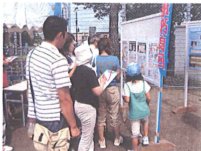
8月5日に開催された東神楽町花祭り