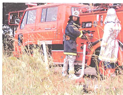
畑地かんがいの給水栓から水を取り防火訓練を行う消防団員