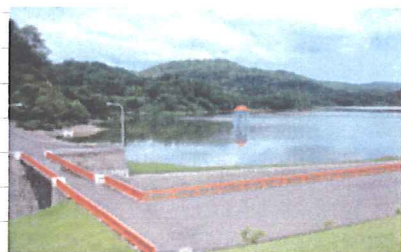
羽幌二股ダム（上羽幌）