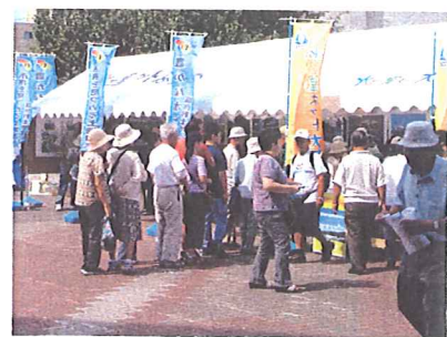
8月26日に開催された旭川市農業まつり