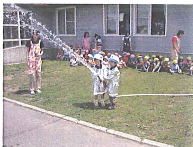
東神楽中央保育園での避難訓練にて、用水路から取水した水を使い放水体験。