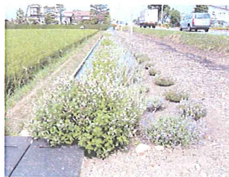
平成16年度に植栽したハーブの現状

植栽したハーブ等の管理について、町内会や新に結成された活動組織が自主的に草取り等を行い、景観向上並びに環境保全に貢献している。