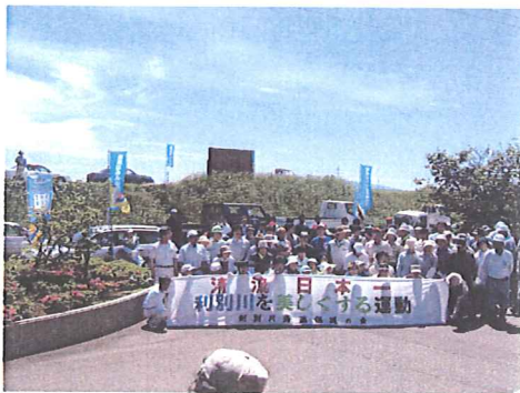
後志利別川」河川清掃に参加