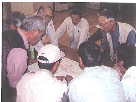
土地改良区区域図を囲みながら「寺小屋やまと」会員との意見交換会。