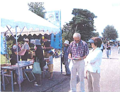
7月29日に開催された東川町どんとこい祭り

市町などが主催する地域のイベントに積極的に参加し、パネルで農業用水の多面的機能、農地・農業用水等の資源保全の重要性などを紹介するほか、パンフレットなどを配布し、水土里ネットの役割などをPRしている。平成19年度は、3回（7月29日、8月5日、8月26日）実施。