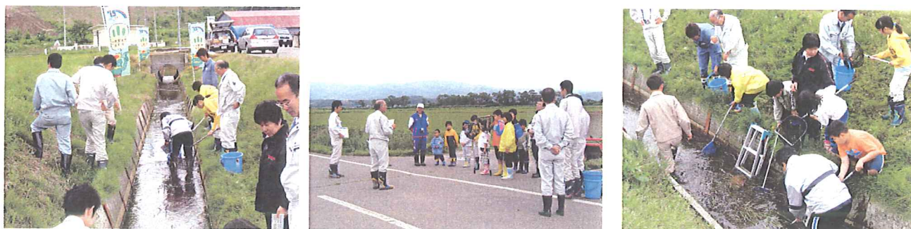
子供達による捕獲体験 多くの子供達が魚等を捕獲するたびに歓声を上げた。

「排水路の生き物探検隊」～函館開発建設部・今金町と連携し、小学生を対象とした生態系保全活動と体験学習の実施。地元小学生に田や排水路での魚類及び蛙等身近な生物を捕獲体験してもらい農地・水・農業用施設の大切さを子供達に肌で感じとってもらった。