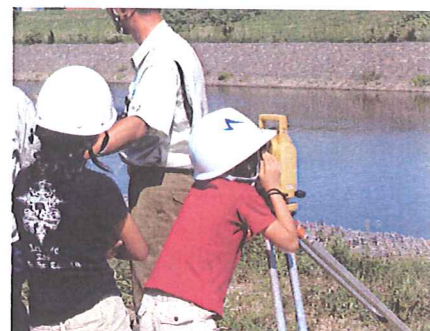
今金小学校4年生40名の総合学習で、頭首工を見学。水土里ネット職員らが施設の役割などを説明