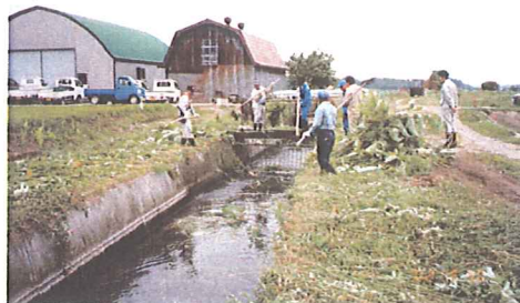
組合員による清掃活動