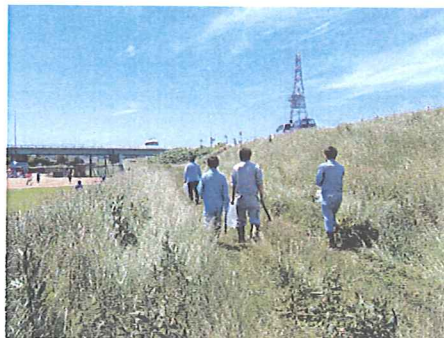
土地改良区でののぼりをたて、水土里ネットの役割をPR