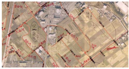
土地改良区へ位置情報の確認を行った図面