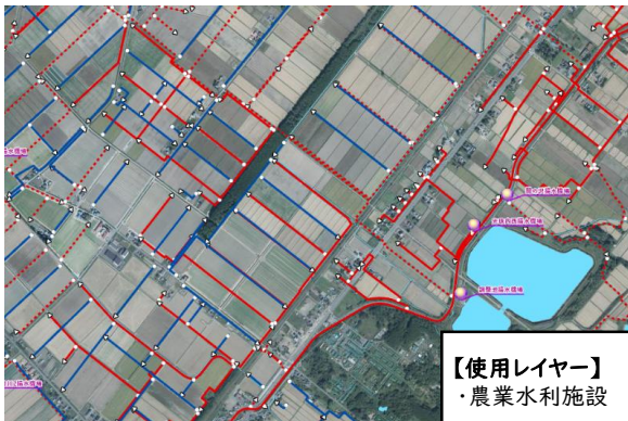
【使用レイヤー】 ・農業水利施設